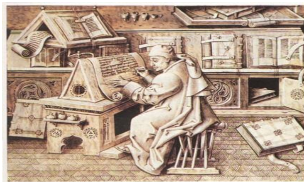
Fig. 2 - Scriptorium