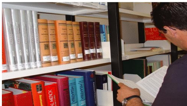
Fig. 3- Livros impressos

E depois da Primeira Guerra Mundial, estes clientes são transformados em consumidores, quando as máquinas evoluem para “produtos”, através da distribuição, comercialização e fabrico anônimo e uniforme desenvolvido após a invenção do tipo móvel e reutilizável por Gutemberg. Nesta fase de evolução, temos livros impressos (fig.2) em grandes quantidades, que eram destinados principalmente a várias bibliotecas ao redor do mundo.