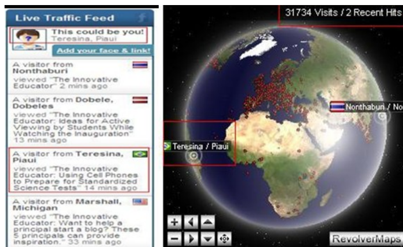
Figs. 5 e 6 - Localizador de usuários online