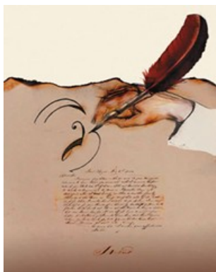
Fig. 1 - Carta à mão

transformando seus utilizadores em clientes. Johnson-Eilola (2010) cita que nesta época os textos eram Artefatos, objetos artesanais: inscrições nas paredes das cavernas, artes em cerâmicas, e manuscritos ilustrados, carta à mão (fig.1). Os textos artefactuais são isolados, estáticos, não se comunicam entre si, exceto pela intervenção humana, um aspecto que vai continuar por muitos estágios da evolução dos textos, intencionalmente feito ou produzido para um determinado fim, em uma situação específica. No entanto, ainda mantêm um grande valor nos dias atuais, pois os textos, na sua maioria, ainda são artefatos. Nossa infraestrutura para os textos está evoluindo, mas ainda muito lentamente. Maioria dos autores/leitores não se comunicam entre si. Não há uma interação interventiva total, afirma o autor.